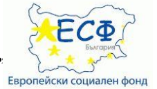
Схема за предоставяне на безвъзмездна финансова помощ BG051PO001-5.2. 15 „ШАНС ЗА ЩАСТЛИВО БЪДЕЩЕ” компонент 2 „Разкриване на иновативни интегрирани услуги за деинституционализация и превенция на изоставянето на деца от 0 до 3 години” Оперативна програма „Развитие на човешките ресурси” 2007-2013 г., съфинансирана от Европейския социален фонд на Европейския съюз