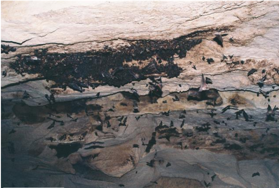
Фигура № 5.1-4. Част от многохилядната размножителна колония на Дългопръстия нощник ( Myotis capaccinii ) в пещерата „Гъбарника“ при с. Красен

литературни данни, непубликувана авторска база данни и собствени теренни проучвания.