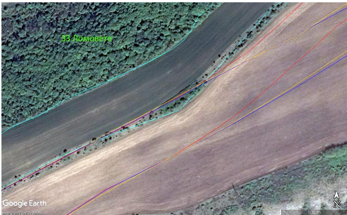
Фиура № 5.1-3: Характер на терена в засегнатата част от полигон на местообитание 91Н0 по МОСВ 2013 (тюркоаз). Оранжев, червен и син контур – обхват на комбиниран, червен и син вариант съответно.

Съгласно данните от проект „Картиране и определяне на природозащитното състояние на природни местообитания и видове - фаза I” (МОСВ 2013), площта на местообитанието в защитена зона „Ломовете” 646.2 дка. Според тези данни, в обхвата и на трите варианти попада част от 1 полигон. При теренните ни проучвания се установи, че този полигон представлява в по-голямата си част обработваема земя – нива, като конкретно в мястото на засягане попада тънка ивица синорна храстова растителност (Фиура № 5.1-3). Подобна растителност не може да се приеме за местообитание 91Н0.