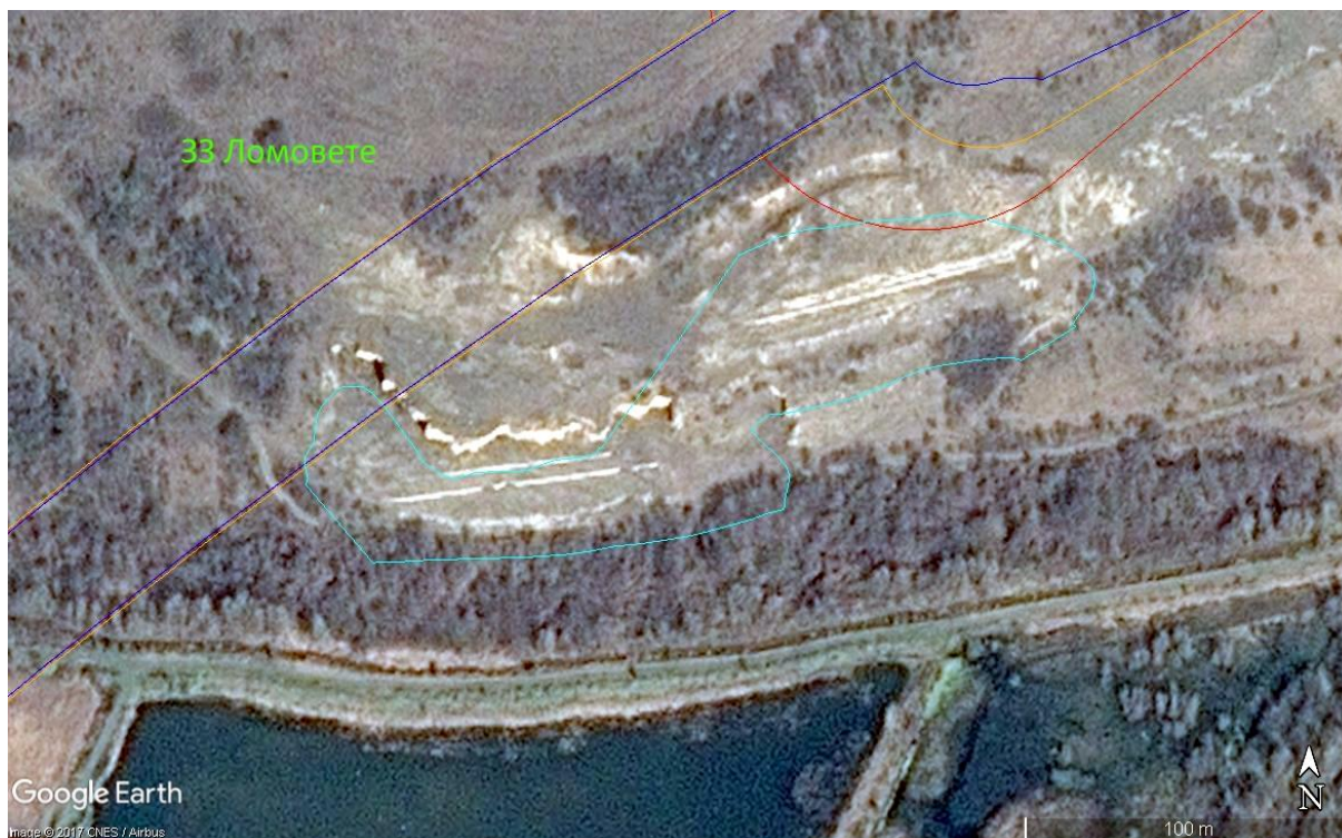
Фиура № 5.1-2. Характер на терена в засегнатата част от полигон на местообитание 8210 по МОСВ 2013 (тюркоаз). Оранжев, червен и син контур – обхват на комбиниран, червен и син вариант съответно.

Местообитание 8210, предмет на опазване в 33 „Ломовете“, не се засяга при нито един от вариантите.