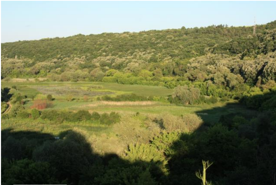
Фигура № 5.1-5. Характер на горската растителност в мястото на пресичане на ЗЗ от трите вариантни решения – потенциално местообитание на широкоухия прилеп ( Barbastella barbastellus ) и Дългоухия ноцинк ( Myotis bechsteinii )

- пряко унищожаване на местообитания: При анализ на резултатите от проект „Картиране и определяне на природозащитното състояние на природни местообитания и видове – фаза I” (МОСВ 2013), както и при проведените собствени теренни проучвания, установихме, че проектният обхват на трасето е част от потенциално местообитание и отсъствие на свързаност с местообитанията с високо качество. Засегнатата площ може да бъде определена и като потенциално ловно местообитание на вида. Горската растителност в мястото на пресичане на ЗЗ е с обща ширина около 200 метра с единични хралупати дървета, потенциално убежище на широкоухия прилеп (фигура № 5.1-5). Очаква се в резултат на строителните дейности да бъдат променени естествените екологични характеристики на 0,48 ха от потенциално местообитание на вида или едва 0,005 % от общата площ на местообитанието в ЗЗ. Засегнатата територия е с недостатъчна площ за да поддържа устойчива популация на вида. По време на експлоатацията не се очаква допълнително унищожаване на площи от местообитания на вида. Възможното изсичане на стари хралупати дървета в обсега на трасето определя незначителна степен на въздействие (степен 1).