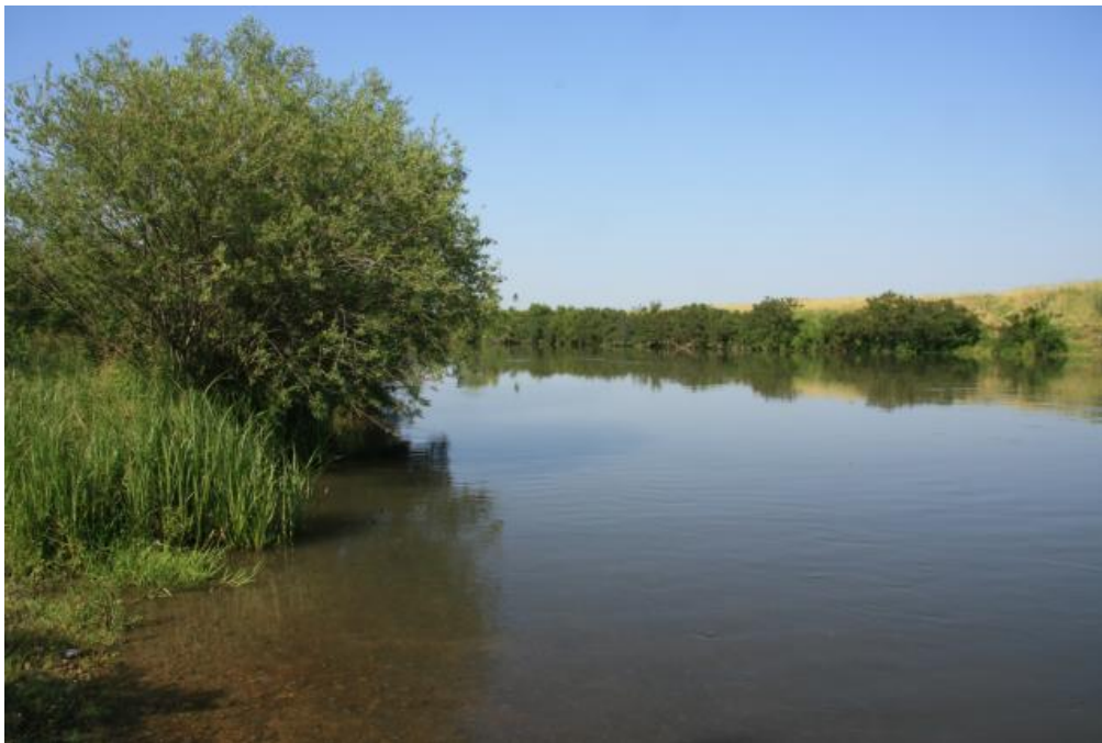
Фигура № 5.1-8. Характер на дървесната растителност в мястото на пресичане на ЗЗ „Река Росица” от вариант „червен” и вариант „комбиниран”.

- пряко унищожаване на местообитания: При анализ на резултатите от проект „Картиране и определяне на природозащитното състояние на природни местообитания и видове – фаза I” (МОСВ 2013), както и при проведените собствени теренни проучвания, установихме, че проектният обхват на трасето не е част от потенциално или ловно местообитание на вида. Горската растителност в мястото на пресичане на ЗЗ е с ширина само няколко десетки метра и граничи с обработваеми земеделски земи и ливади. Отсъстват дървета във фаза на старост, а засегнатата територия е с недостатъчна площ за да поддържа устойчива популация на вида (фигура № 5.1-8). По време на експлоатацията не се очаква допълнително унищожаване на площи от местообитания на вида. Без въздействие (степен 0).