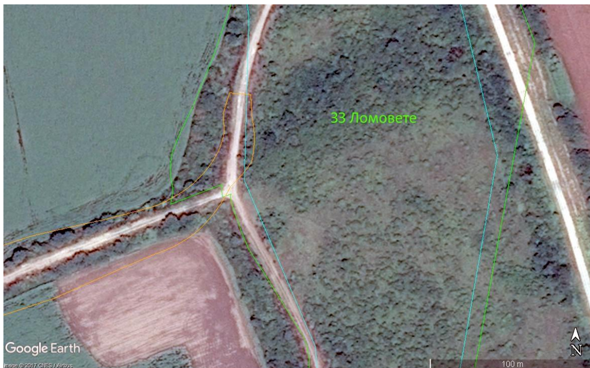
Фиура № 5.1-1 Характер на растителността в засегнатата част от полигон на местообитание 6250 по МОСВ 2013 (тюркоаз). Оранжев контур – обхват на комбиниран вариант.

Местообитание 6250, предмет на опазване в 33 „Ломовете“, не се засяга при нито един от вариантите.