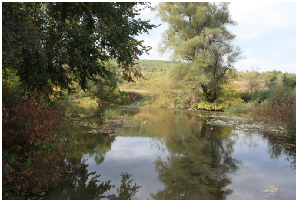
Фигура № 5.1-6. Характер на крайбрежната горска растителност в мястото на пресичане ЗЗ от вариантите решения „червен” и „комбиниран” при км 121+200.

- фрагментация на местообитанията : Не се очаква. Без въздействие (степен 0).