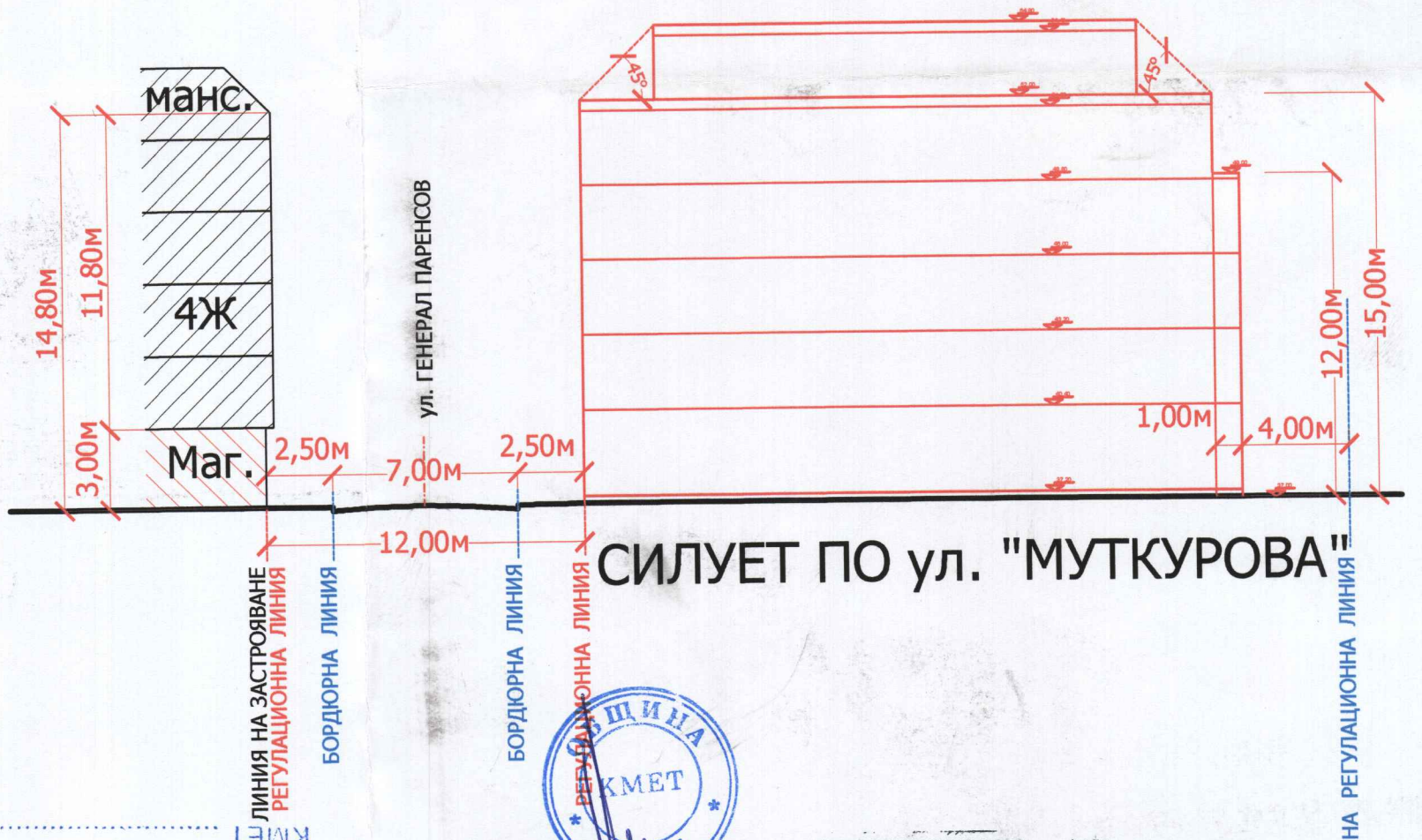
СИЛУЕТ ПО ул. "МУТКУРОВА"