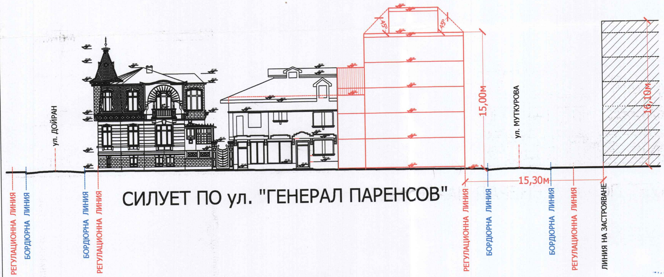
СИЛУЕТ ПО ул. "ГЕНЕРАЛ ПАРЕНСОВ"