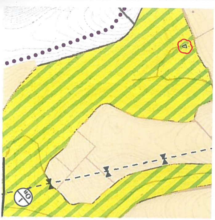
Извадка от действащ ОГП на гр. Русе М1:15 000

увеличени замесени, лесни аграрни, малки (семежни) хотели до 20 места, малки търговски обекти в сгради с друго основно предназначение, едноетажни вилни сгради на собственици на имоти. Правилата и нормативите са съвместими с тези за Соф. Вилна зона (0а) - устройват се съгласно чл. 29 от Наредба №7 Пазстр - от 15 до 40%, Кинт - от 0,5 до 0,8, Поедл. - от 50 до 80%, височина - 7,0 м, а до бялото на покрива - 10 м. Смесена централна зона (Ц) - устройва се съгласно глава X от Наредба №7 Предназначена е за многофункционално ползване. Допустимите за изграждане обекти са: Ц - разположеност на Ц - със заложените показатели на норматива за интензивност на застрояване и ограничения в характера и плевина на застрояване: Кинт - до 4,0; Поедл. - Мин. 20% от изстрояваната площ на имота, макс. Етажност - до 3 ет.; М - триетажен етаж; плевина на застрояване - предимно свободно и свързано в два имота, съобразно задръпаните плевани на застрояване