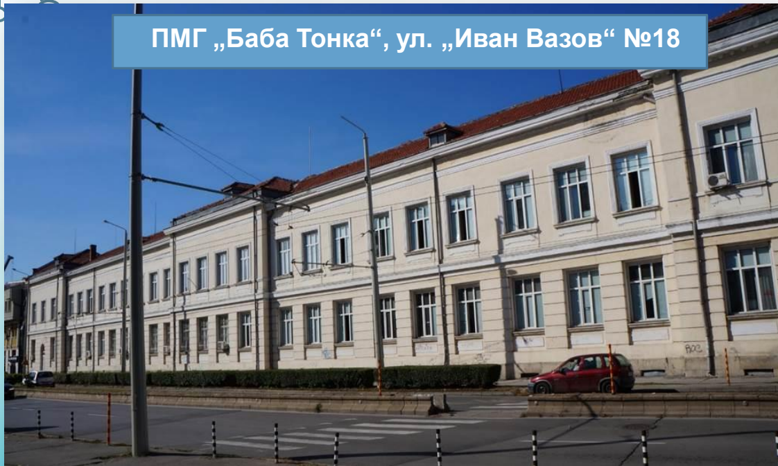
ПМГ „Баба Тонка“, ул. „Иван Вазов“ №18